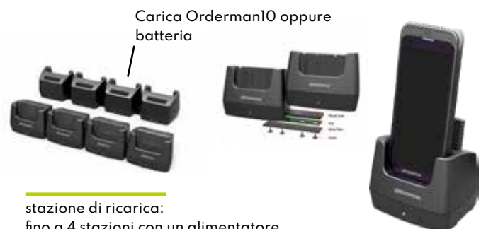
stazione di ricarica: fino a 4 stazioni con un alimentatore